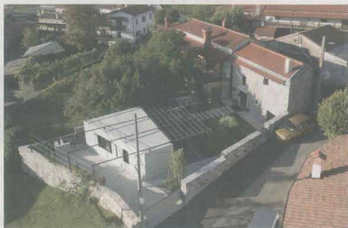
Kambra se nahaja v središču Pliskovice

Kambra je poslej izhodišče za spoznavanje Krasa: najprej s turo po vasi Pliskovica, potem za daljše pohode, kolesarjenje ali vožnjo z motorjem, spoznavanje tukajšnje kulinarike, blizu je morje in navezadnje tudi Ljubljana. »Bo pa treba razširiti glas, ta pa se najučinkoviteje množi po družbenih omrežjih in s pomočjo blogerjev,« se zaveda njena mama gostiteljica.